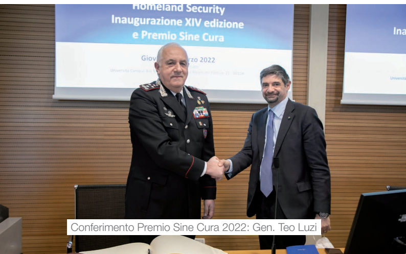
Conferimento Premio Sine Cura 2022: Gen. Teo Luzi